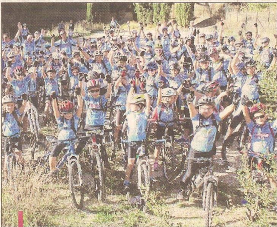
Plus de 200 passionnés, petits et grands, s'adonnent en toute convivialité à leur passion pour le VTT.

La section VTT de la MJC Plan-de-Cuques, c'est avant tout une famille. Pour s'en persuader, il suffit de se rendre le mercredi et le samedi, aux alentours de 14h, dans le quartier de la Montade d'où, des vététistes de 7 à 77 ans, partent s'entraîner. Là, les "grands" du team de Division Nationale 3 côtoient les minots de l'école de VTT, tous aussi attachants les uns que les autres.