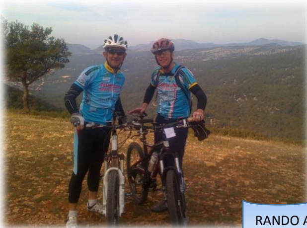
RANDO A CEYRESTE