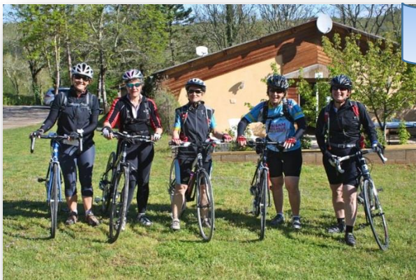
RANDO ST POMPON

La section VTT adultes participe également à de nombreuses randonnées organisées par des clubs voisins :